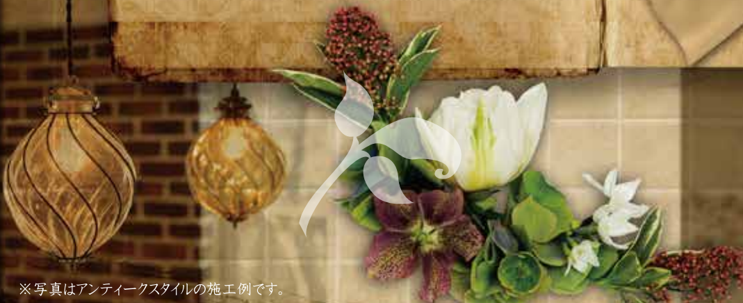
※写真はアンティークスタイルの施工例です。